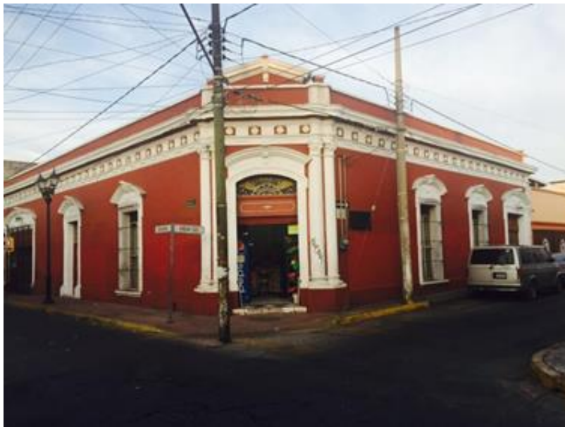
Ilustración 2: Antigua cámara de diputados

Diversas organizaciones han desarrollado metodologías para llevar a cabo inventarios del patrimonio cultural, tanto material como inmaterial. Para su elaboración se requiere de información de los bienes patrimoniales, la cual se obtiene mediante trabajo de campo, en el cual interviene la observación y las entrevistas. El registro de la información se hace en diversos formularios, tanto impresos como electrónicos.